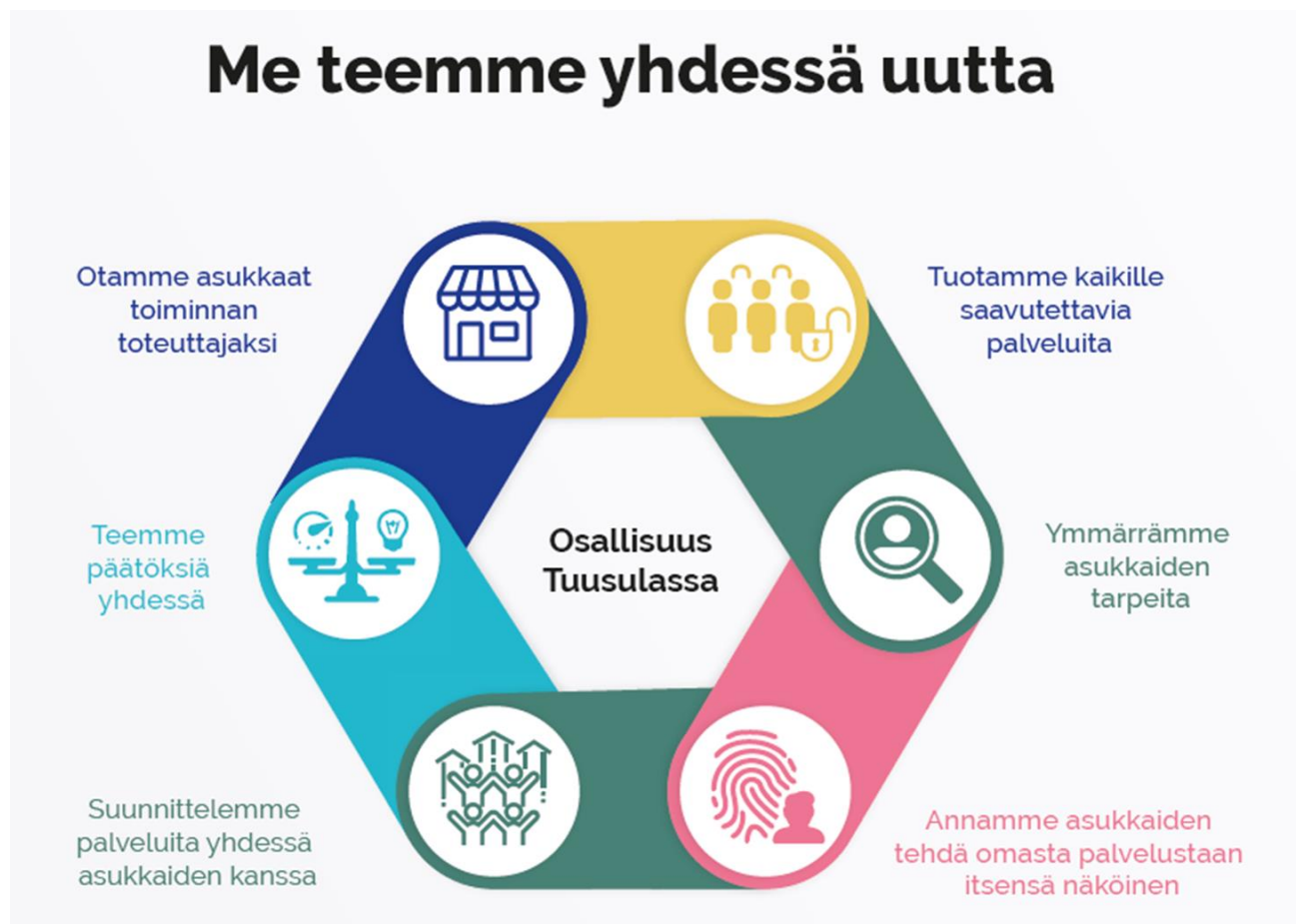
Tuusulan osallisuusmalli (2017)

Tuusulan kunnan osallisuusmalli määrittää miten kaikkien kuntalaisten osallisuutta edistetään kunnan palveluissa.